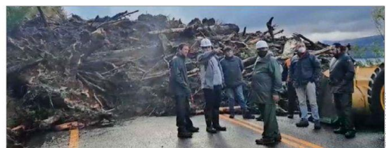
REMOCIÓN EN MASA. —Cientos de toneladas de tierra, vegetación y escombros mantienen interrumpida la Ruta CH-201, que rodea el lago Calafuén, conectando Coñaripe con Panguipulli, en la Región de Los Ríos.

Las áreas de estudio que se vieron más afectadas por esta disminución son de la salud, con un 46,5% de baja; derecho, con una caída de 27%; el sector agropecuario, con un 21,6%, y la de tecnología, con 21,4% (ver infografía).