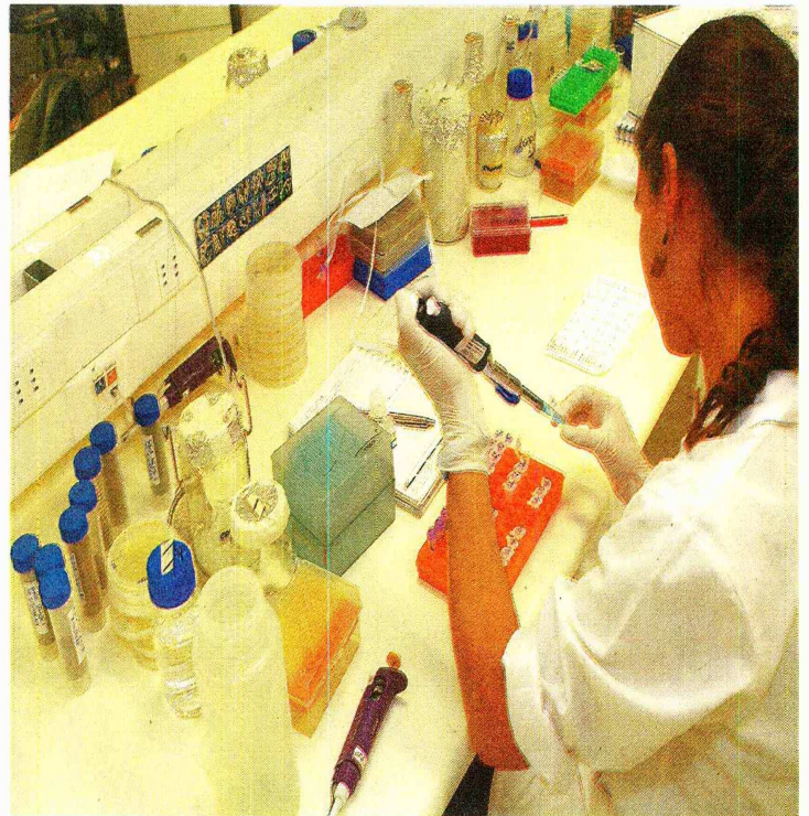
LAS MODIFICACIONES, en general, fueron bien recibidas por las universidades del país.