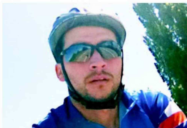
ESTE ODONTÓLOGO ENTRENA TODAS LAS MAÑANAS PARA EL IRONMAN

- Cuando comencé en el triatlón, el sueño mío era poder