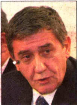
Zilic, en la onda con Lavín.

“ Fue golpe a golpe, pero tengo el cuero duro ” Lavín y su calvario